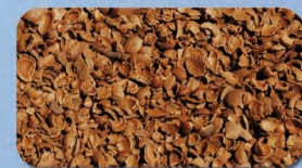
Cusci di mandorle, nocciole e pinoli - Almond, hazelnut and pine shells