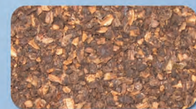
Sansa di olive Olive Husks